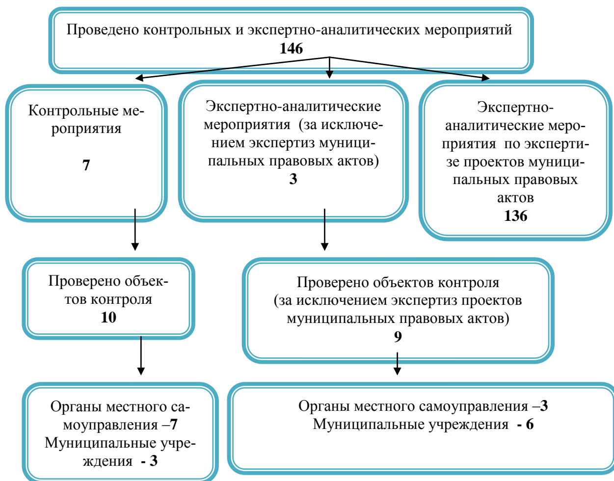
Рис. 1. Контрольная и экспертно-аналитическая деятельность в 2022 году

Общие итоги работы Контрольно-счётной палаты за 2022 год характеризуются следующими показателями: