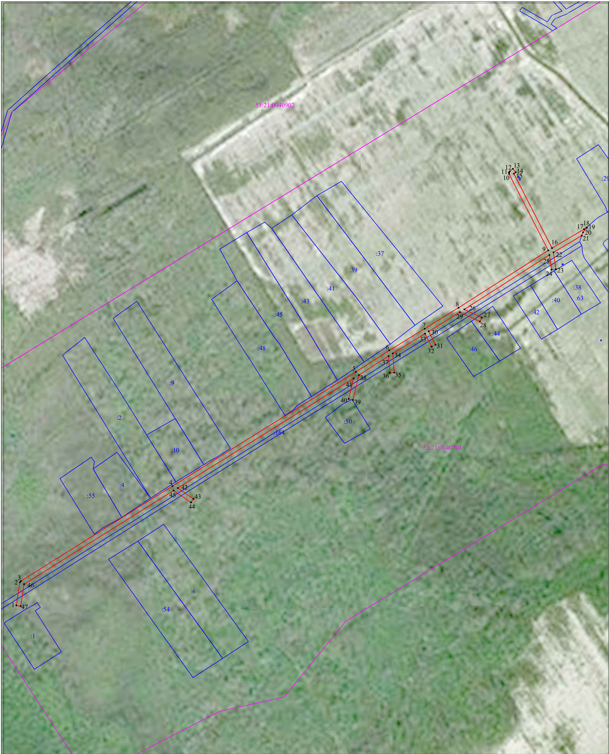
Масштаб 1:2 000