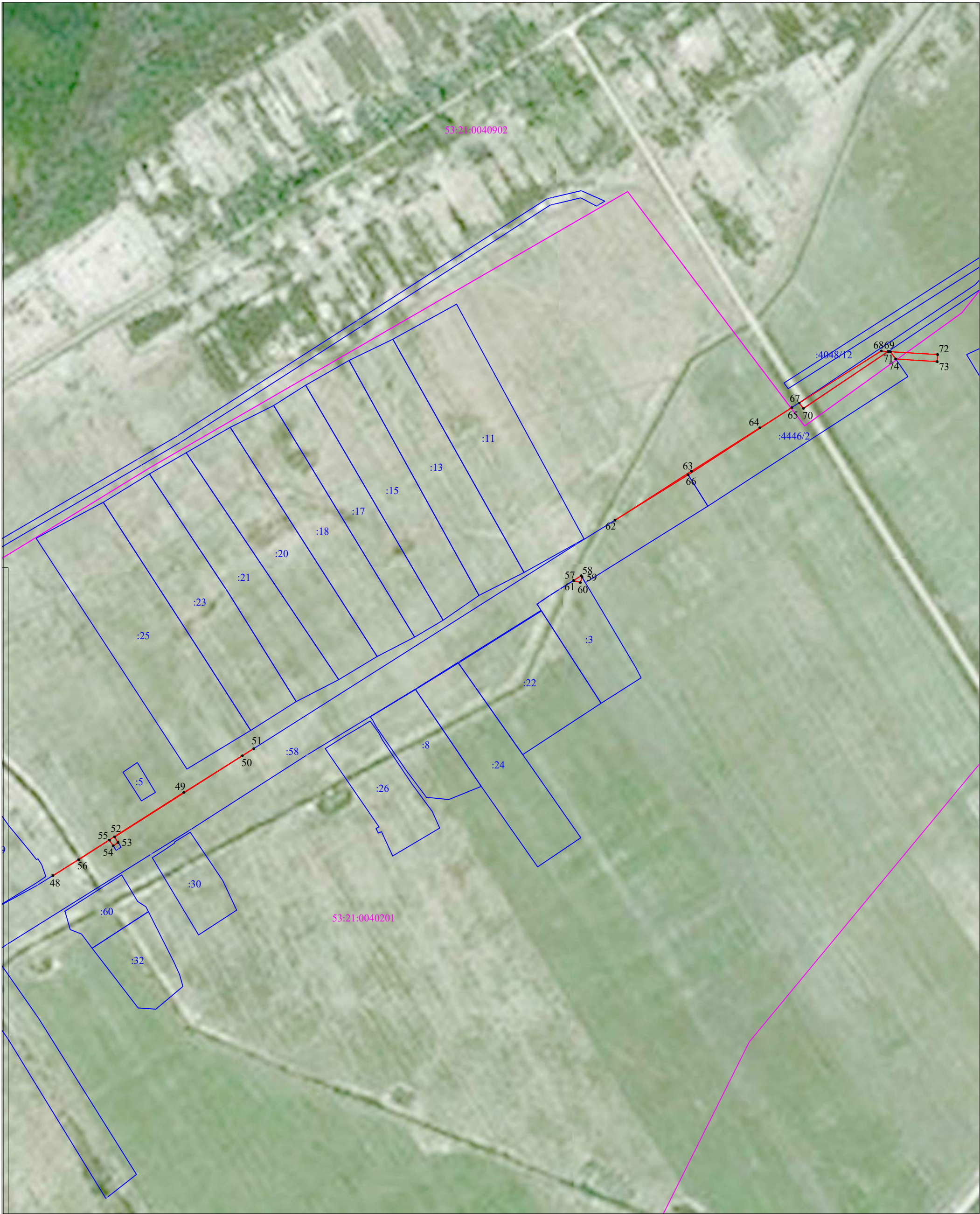
Масштаб 1:2 000